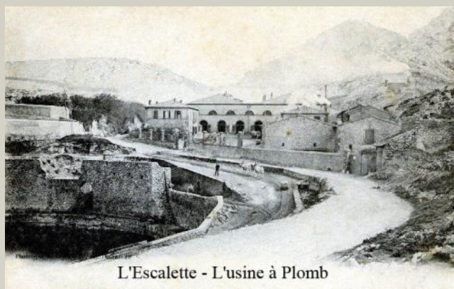
L'Escalette - L'usine à Plomb

Le massif des Calanques est mondialement connu pour ses falaises calcaires, la richesse de ses fonds marins, ses criques, sa beauté sauvage, mais qui se souvient de son passé industriel ? Les sites industriels implantés dans les calanques ont pourtant représenté pendant plus d'un siècle une part importante de l'économie de Marseille. Leur activité a eu de terribles conséquences pour les hommes et l'environnement. Le décor était à ce point sinistre qu'on peut lire sur une carte postale de l'époque « Même le diable n'y vivrait pas » !